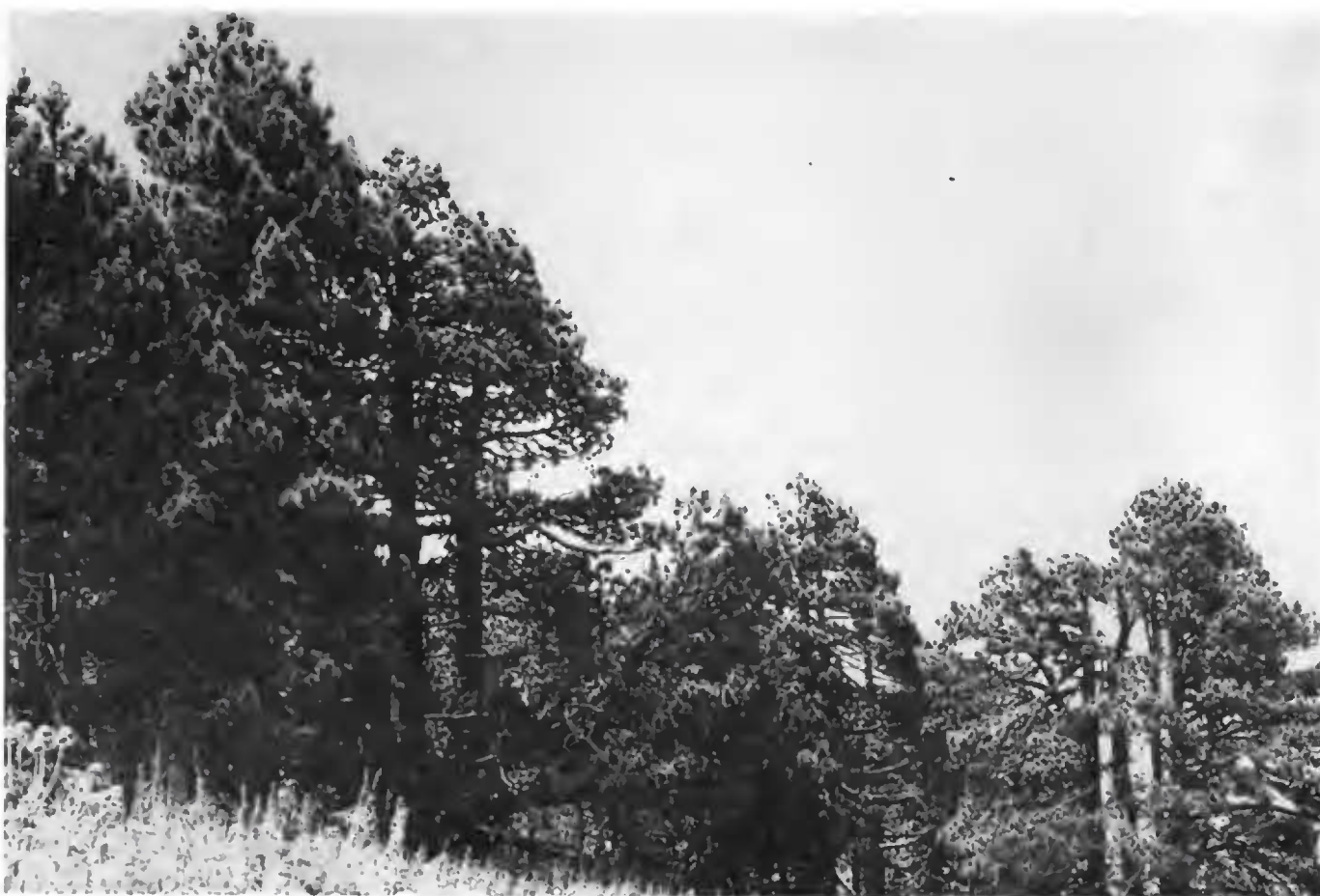
Fig. 5. Bosque de Pinus hartwegii .